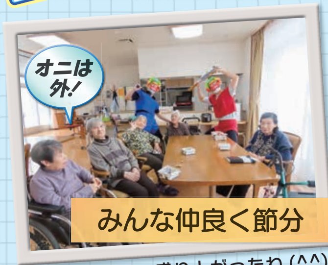
みんな仲良く節分