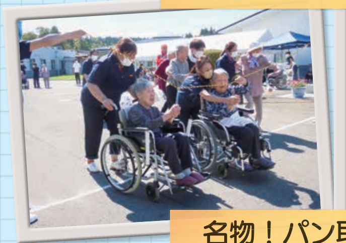
名物! パン取り競走