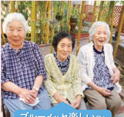
ブルーメッセ楽しい～